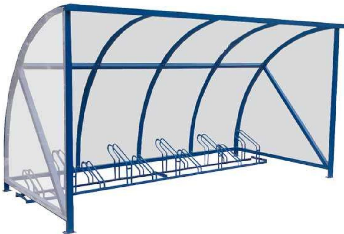
Figure 1. Abri vélo Quarter