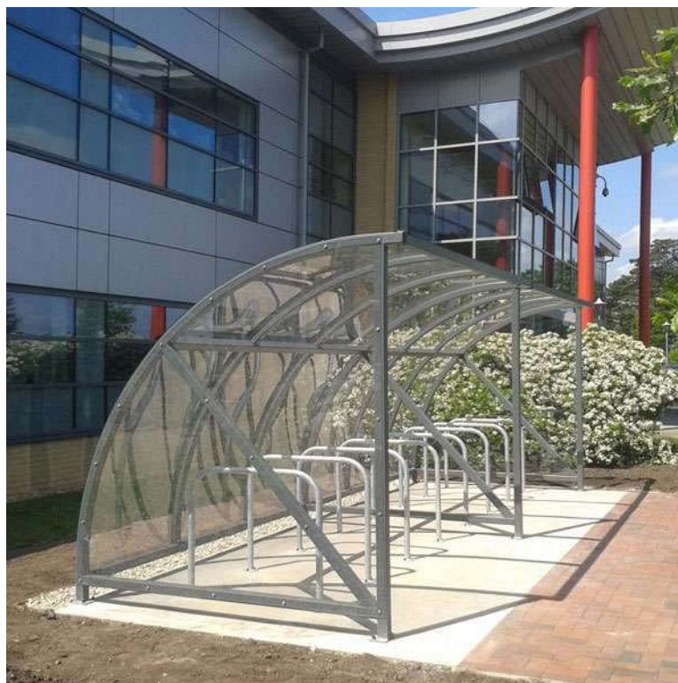
Figure 4. Abri vélo Quarter devant une entreprise