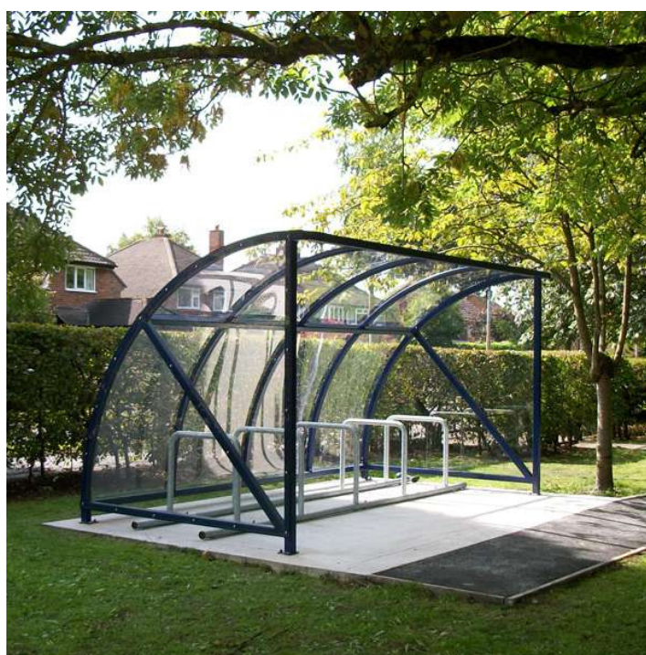
Figure 2. Abri vélo Quarter

En plus de l'auvent unilatéral, cet abris peut également être conçu en auvent combiné. Egalement, il peut être fermé via deux versions unilatérales complétées par une couverture de passerelle et une fermeture