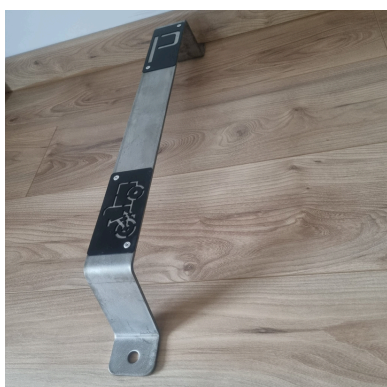
Figure 2: Photo Rack cargo Cycloove avec signalétique