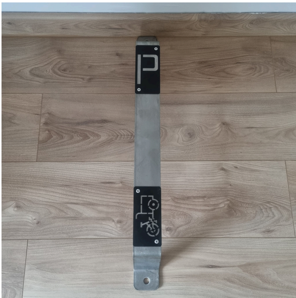
Figure 1. Rack "Petit Cycloove" cargo