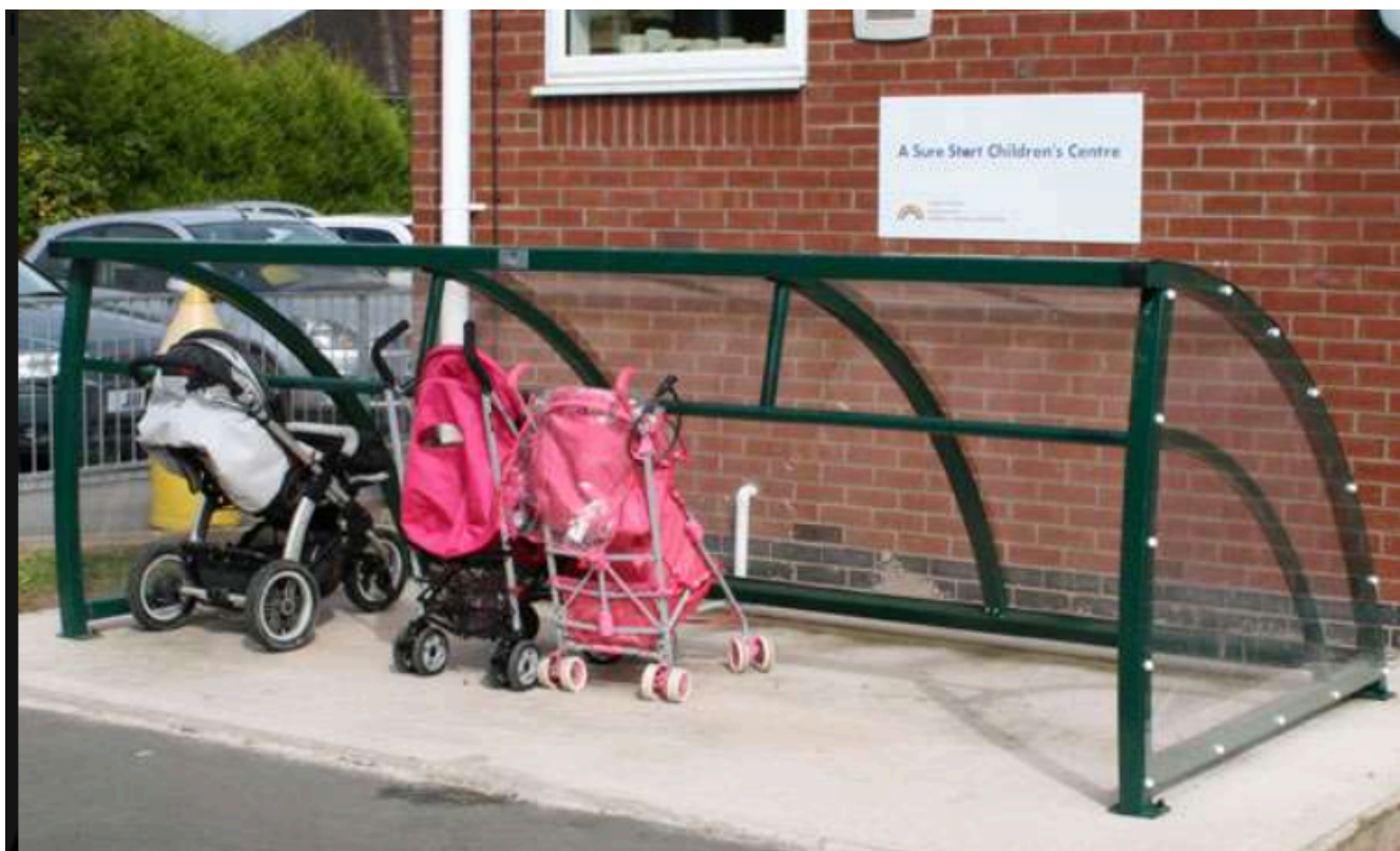
Figure 1. L'abri poussette "FalcoRoller"

Pour poussettes, fauteuils roulants, déambulateur à roulettes