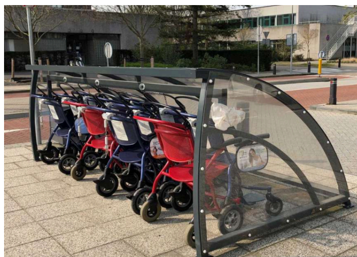
Figure 2. Photo abri fauteuils roulants